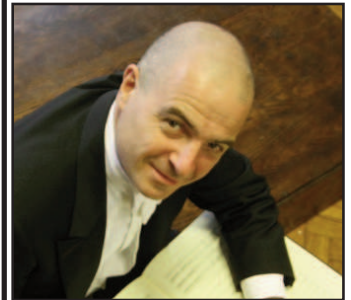
Giovanni Battista Rigon

Sabato 6 giugno e sabato 13 giugno le Settimane Musicali al Teatro Olimpico in collaborazione con la Fondazione Teatro La Fenice di Venezia portano al Teatro Olimpico Il Signor Bruschino, una delle cinque farse che segnano il debutto veneziano di Gioachino Rossini. Regista di questo allestimento vicentino è il maestro Bepi Morassi, che "adatta" alla scena olimpica la sua recente regia per la Fondazione Teatro La Fenice di Venezia. Le Settimane Musicali inaugurano con "Il Signor Bruschino" il progetto Opera Lab, una nuova iniziativa di durata quinquennale che offre ai cantanti lirici iscritti ai conservatori del Veneto l'opportunità di partecipare a una produzione operistica nell'ambito del festival. Ad affiancare i tenori Elvis Fanton e Francisco Brito, è infatti un cast selezionato attraverso il bando promosso dall'associazione Settimane Musicali al Teatro Olimpico in tutti i conservatori del Veneto. Confermata la presenza dell'Orchestra di Padova e del Veneto guidata da Giovanni Battista Rigon , direttore d'orchestra presente nella programmazione dei maggiori teatri italiani. Andata in scena per la prima volta il 27 gennaio 1813 al Teatro San Moisè di Venezia, Il signor Bruschino è un'opera breve composta da un unico atto. Realizzato in collaborazione con la Fondazione Teatro La Fenice di Venezia, il Signor Bruschino è ospitato dal Teatro Olimpico in quattro recite: sabato 6 e sabato 13 giugno, in doppio turno, alle ore 18 e alle ore 21.